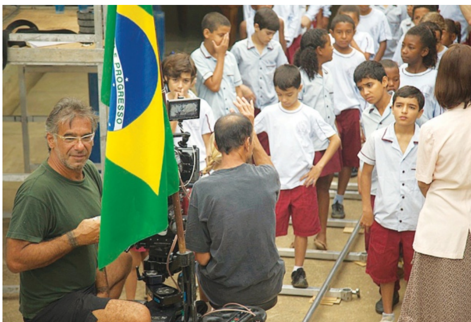
Novas atividades econômicas, ideias e produções cinematográficas que envolvem a criatividade fazem de Cataguases uma cidade-referência para a